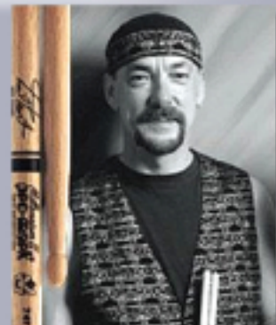
Neil Pearl Rush

...y también, pro-mark presenta su línea L.A. SPECIAL